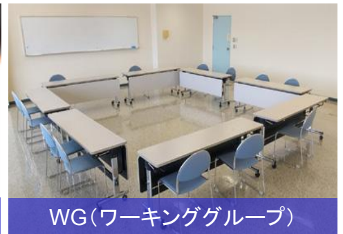
WG(ワーキンググループ)