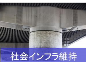
社会インフラ維持